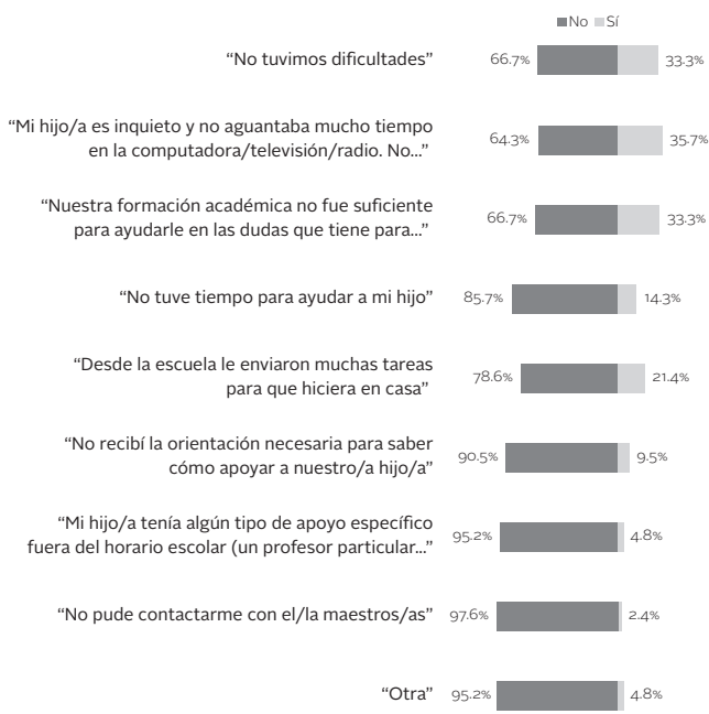
Figura 5. Dificultades que se presentaron a los encuestados para ayudar a los hijos(as) durante la pandemia

otros que fueron abordados en este estudio cobran una relevancia particular al vincularlos con las condiciones laborales, económicas y sociales de las familias y parecen ratificar las propuestas teóricas en las que se sostiene la presente investigación.