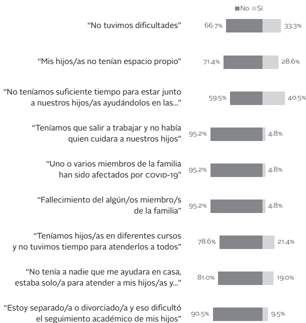
Figura 4. Dificultades familiares en casa para llevar a cabo las actividades escolares

có no contar con tiempo suficiente para apoyar a sus hijos, más la ausencia de espacios apropiados para la escuela (28%), hijos en diferentes cursos escolares y falta de tiempo para atenderlos, entre otros factores (véase Figura 4).