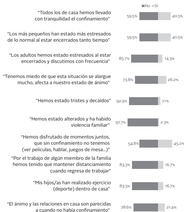
Figura 2. Valoración de las relaciones en casa durante la pandemia

pondientes expresaron que el ánimo y las relaciones en casa no son iguales que cuando no había confinamiento.